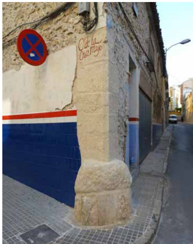
Rótulo restaurado en C/ Cruz de Mayo.

Recuperación y restauración de un antiguo rótulo de calle pintado sobre sillares, en la calle Cruz de Mayo.