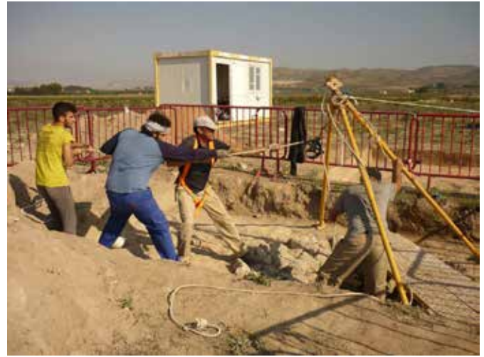
VI Campaña de excavaciones arqueológicas en la villa romana de Casas del Campo.