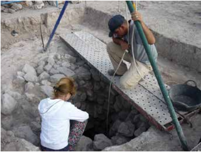
V Campaña de excavaciones arqueológicas en la villa romana de Casas del Campo.