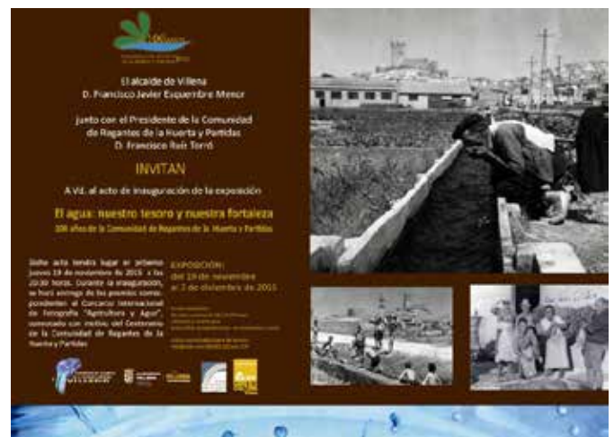
Exposición conmemorativa del Centenario de la Comunidad de Regantes de la Huerta y Partidas de Villena.

Del 19 de noviembre al 3 de diciembre de 2015: exposición titulada "El agua: nuestro tesoro y nuestra fortaleza", conmemorativa del Centenario de la Comunidad de Regantes de la Huerta y Partidas, en la Casa de Cultura. Esta muestra fue creada y producida por la Casa de la Cultura y el Museo Arqueológico, cediéndose para la misma algunas piezas de nuestras colecciones.