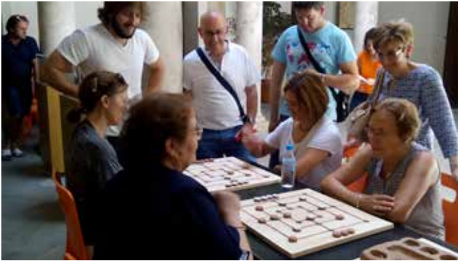
Aprendiendo a jugar al Alquerque, en el taller didáctico organizado con motivo de las Jornadas de Puertas Abiertas.

30 de julio de 2015: instalación de dos piezas del museo en el casco histórico de nuestra ciudad. Se trata de una reja de hierro de una ventana tradicional y un molino de piedra que se colocaron en las calles La Leña y Primera Manzana, aprovechando los talleres de la 3 a edición del CASC (Certamen de Activación Sociocultural del Casco Histórico de Villena).