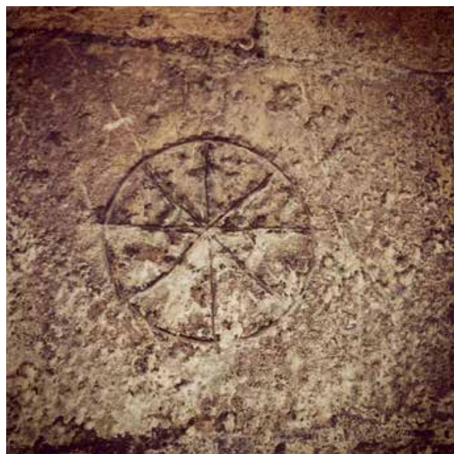
Marca de la tahúlla de Villena en el muro exterior de la Iglesia de Santiago