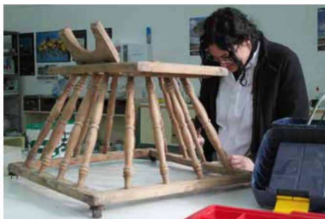
Restauración fondos etnográficos del museo.

en el nuevo Museo de la Ciudad, actualmente en construcción. Dado que se trata de una campaña de contratos de formación, se han seleccionado piezas fabricadas en madera, hueso, metal, cerámica y piedra, de manera que pudieran tratar con distintos materiales. Entre las piezas restauradas destacamos las siguientes: cuencos de cerámica prehistórica e ibérica, platos de cerámica vidriada del siglo XIX, pipas, aceiteras y botijos de principios del XX, un cuchillo romano de hierro y de madera, un atroz, una mecedora, un tacataca, dos ventanas y un termómetro.