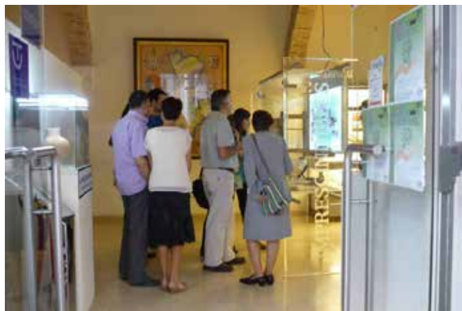
Visitas guiadas organizadas en el museo con motivo del Día Internacional de los Museos 2015.