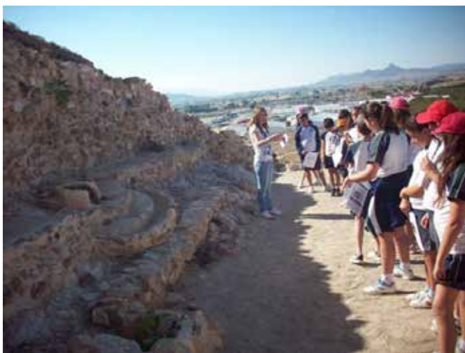
Taller de Prehistoria, en el Cabezo Redondo.

Taller de Prehistoria 2014 (desde el 5 de mayo hasta el 2 de junio), participando los siguientes centros educativos de Villena: Salesianos, Ruperto Chapí, La Celada, Paulas, Príncipe don Juan Manuel, El Grec, Santa Teresa, Carmelitas y Apadis. En total, 378 escolares de entre 4º y 6º de Primaria.