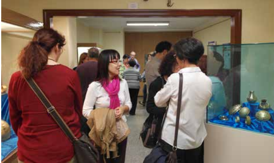
Inauguración exposición del Tesoro de Villena en el Museo Arqueológico de Novelda.

18 de mayo de 2014: actividades relativas al Día Internacional de los Museos. Conferencia titulada "Vida y muerte en el III milenio a.C. en el Peñón de la Zorra", a cargo de Gabriel García Atiénzar. Apertura gratuita del museo. Exposición "Prestigio y Eternidad" en la vitrina de Imprescindibles del museo.