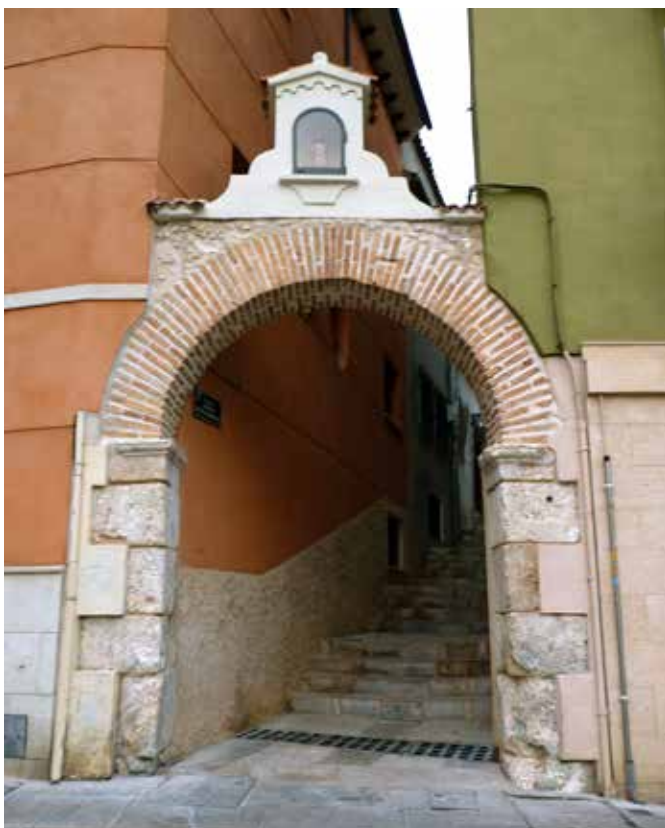
Arco de la Subida de Santa Bárbara, una vez finalizados los trabajos de restauración.

Trabajos de conservación y restauración en el arco de la Subida de Santa Bárbara.