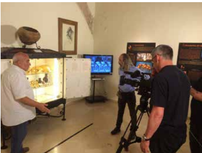
Grabaciones realizadas por el equipo de RTVE en el museo.

30 de septiembre y 7 y 14 de octubre de 2015: emisión de un documental sobre el Cabezo Redondo en el programa "El túnel del tiempo" que se emite dentro de "La Aventura del Saber", en la 2 de televisión española. Dichas grabaciones se realizaron durante el mes de abril del presente año 2015.