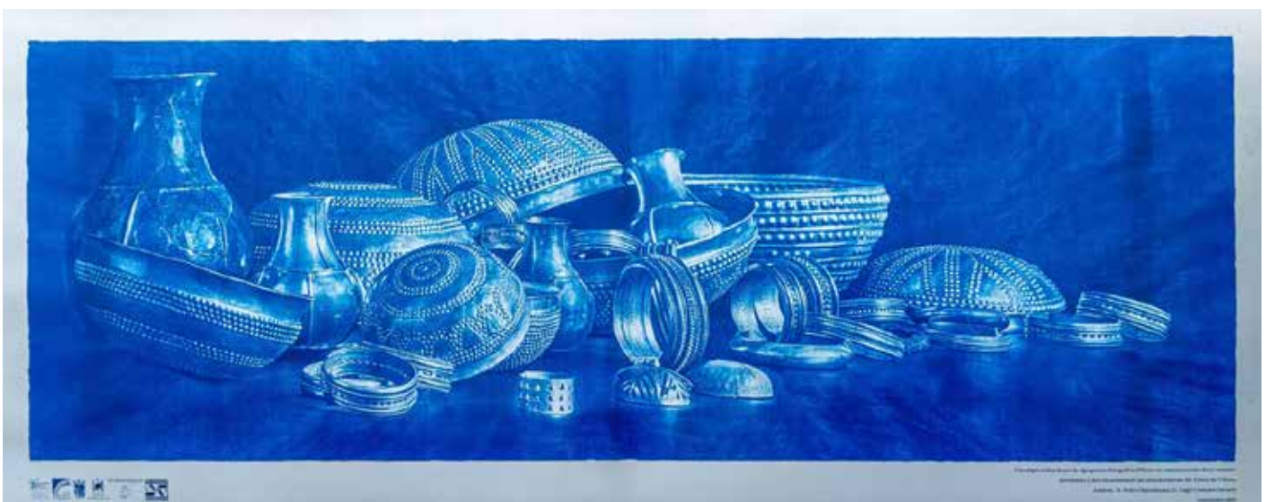
Imagen de la cianotipia que refleja el Tesoro de Villena, con la que la Asociación Fotográfica Villena consiguió el Guinness.