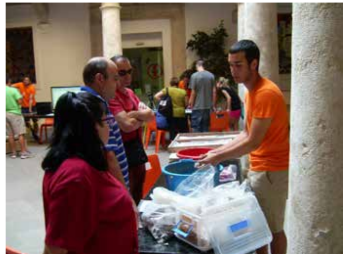
Taller organizado en el museo con motivo de las Jornadas de Puertas Abiertas.

26 y 27 de julio de 2014: XVIII Jornadas de Puertas Abiertas en el Cabezo Redondo y el Museo Arqueológico y taller "El laboratorio de Arqueología", a cargo de ArqueUA. Un total de 800 visitantes acudieron a la cita anual de los arqueólogos del Cabezo Redondo, quienes explicaron las características de los descubrimientos y respondieron a las cuestiones planteadas en todos los grupos. Por otra parte, en el museo se realizaron visitas guiadas que completaban el conocimiento de Cabezo Redondo a través de los restos materiales de la sala de exposición. Además, se realizó el taller didáctico "El laboratorio de Arqueología", realizado en esta ocasión por un grupo de arqueólogos del Cabezo Redondo, donde se mostraba el proceso que recorren los objetos desde que son descubiertos en la excavación hasta su posterior estudio en el laboratorio y, finalmente, su publicación en revistas o libros científicos. Un total de 323 personas experimentaron en diferentes mesas de trabajo el proceso seguido por los arqueólogos en el estudio de los descubrimientos.